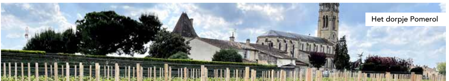
Het dorpje Pomerol

De wijnen van oenoloog Denis Dubourdieu, die onlangs overleden is, werden geproduceerd op Château Reynon, dat hij erfde van zijn schoonfamilie. De Reynon wijngaard strekt zich uit over 28 hectare op een opmerkelijk terroir: diep grind op klei bovenaan de helling, een meer kalkachtig gebied halverwege de helling, en zanderig aan de voet van de helling. Deze wijn heeft het potentieel om zich opmerkelijk goed te ontwikkelen in de fles gedurende meerdere jaren! (2027-2036)