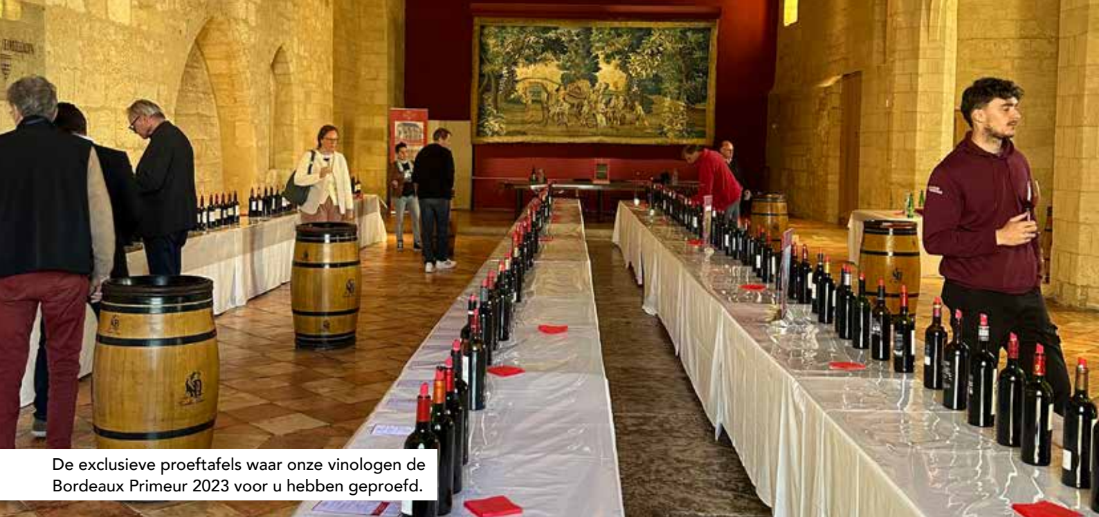
De exclusieve proeftafels waar onze vinologen de Bordeaux Primeur 2023 voor u hebben geproefd.