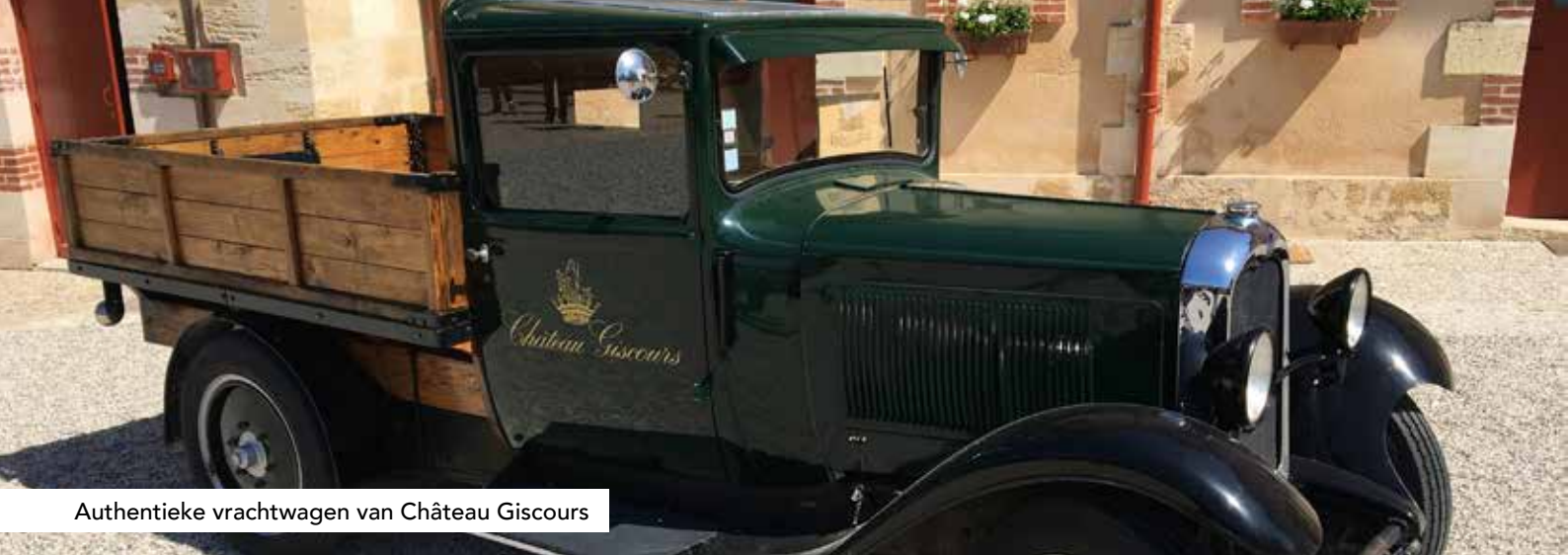
Authentieke vrachtwagen van Château Giscours