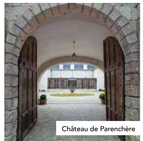
Château de Parenchère