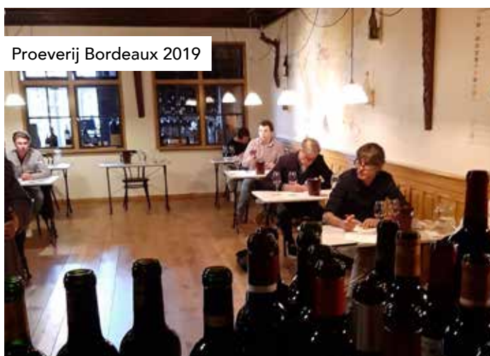
Proeverij Bordeaux 2019