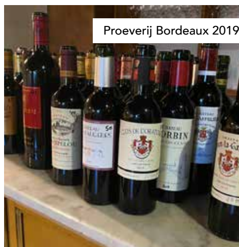
Proeverij Bordeaux 2019