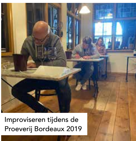
Improviseren tijdens de Proeverij Bordeaux 2019

Complexe aroma's van donker fruit, bosvruchten, vanille en cederhout. De kleur is donker en de afdrank is gul. Één derde van de vaten is nieuw, en de rijping duurt gemiddeld veertien maanden. (2023-2029)